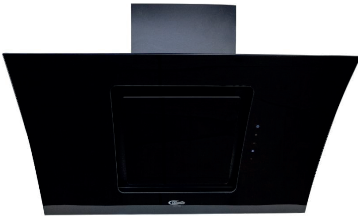
FILTRO DE CARBÓN ACTIVADO