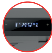
PANEL TOUCH DIGITAL